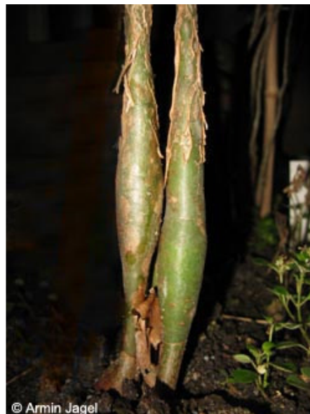
Abb. 13: ... junge Sprosse von Commiphora opobalsamum