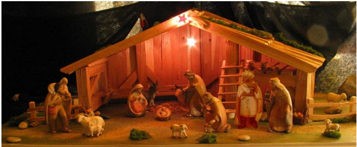
Abb. 1: Krippe im Studentenwohnheim Roncalli-Haus in Bochum

...siehe, da kamen Weise vom Morgenland nach Jerusalem und sprachen: Wo ist der neugeborene König der Juden? Wir haben seinen Stern gesehen im Morgenland und sind gekommen, ihn anzubeten. ... Und siehe, der Stern, den sie im Morgenland gesehen hatten, ging vor ihnen hin, bis dass er kam und stand oben über, wo das Kindlein war. Da sie den Stern sahen, wurden sie hoch erfreut und gingen in das Haus und fanden das Kindlein mit Maria, seiner Mutter, und fielen nieder und beteten es an und taten ihre Schätze auf und schenkten ihm Gold, Weihrauch und Myrrhe. (Evangelium nach Matthäus)