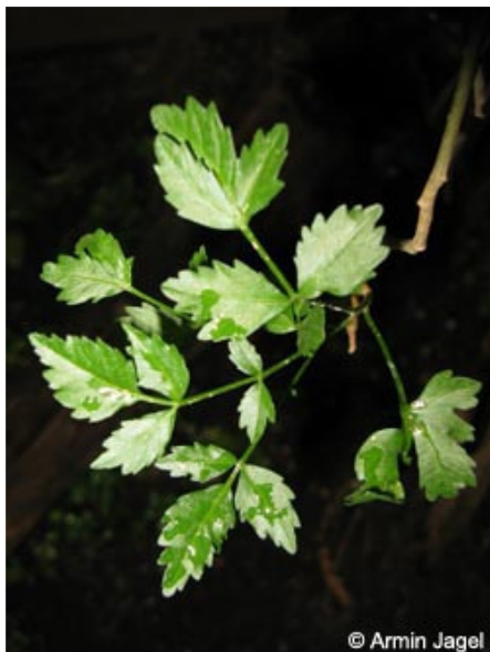
Abb. 12: Blätter und ...

Historisch betrachtet wurde Myrrhe in verschiedenen Kulturen zur Einbalsamierung von Toten verwendet. Auch wurde ein Myrrhezweig Toten mit ins Grab gelegt bzw. von Witwen am Herzen getragen.