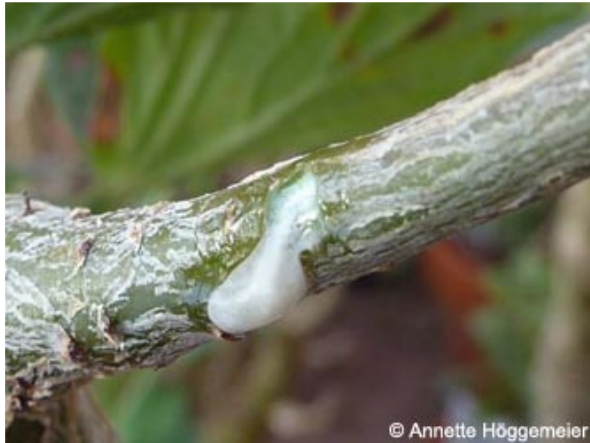
Abb. 14: Austretender Saft nach Anritzen eines Astes.