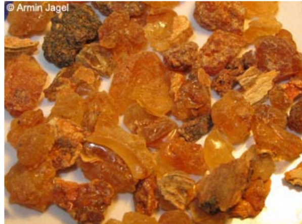
Abb. 15: Myrrhe-Brocken ( Commiphora myrrha )

Jedoch ist nicht zu verschweigen, dass Myrrhe in anderen Kulturen eine ganz andere Symbolik trägt und zu völlig anderen Zwecken verwendet wurde. So galt es z. B. als Aphrodisiakum und findet sogar bis heute Verwendung in Parfüms (z. B. in "Opium" von St. Laurent und "Fidji" von Guy Laroche). In der griechischen Mythologie war Smyrna (griech. für Myrrhe und gleichzeitig der griechische Name der türkischen Stadt Izmir) ein hübsches Mädchen, dessen Mutter damit angab, dass ihre Tochter schöner sei als Aphrodite (immerhin die Göttin der Schönheit!). Diese legte daraufhin Smyrna unerkant ins Bett ihres Vaters. Als der Vater die Umstände erkannte, brachte er sich um. Smyrna wurde schwanger und in einen Myrrhenbaum verwandelt. Diana, die Göttin der Geburt, spaltete den Baum und daraus entstieg der berühmte Adonis, dessen Name heute sinnbildlich für einen schönen Mann benutzt wird.