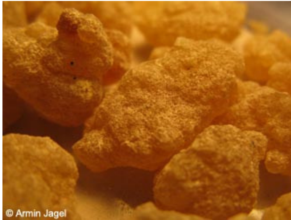
Abb. 10: Harzbrocken des Somalischen Weihrauchs ( Boswellia sacra ) ...

Pro Baum können jährlich mehrere Kilogramm Harz gewonnen werden. Aus dem Harz wird auch das ätherische Öl gewonnen, welches z. B. in Parfüm verwendet wird. Die Weihrauchbrocken enthalten etwa 70 % Harze, 27 bis 35 % Gummi und 3-8 % ätherische Öle.