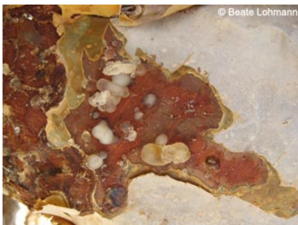
Abb.9: Brocken von getrocknetem Harz an einem Baumstamm

Die Heimat des Somalischen Weihrauches ( Boswellia sacra ) liegt in Somalia, Ägypten und Südarabien (Oman und Jemen), also in sehr trockenen Regionen. Boswellia serrata stammt aus Trockengebieten Indiens. Ein Anbau der Arten zur kommerziellen Weihrauchproduktion wird außerdem noch in wenigen weiteren Ländern mit ähnlichem Klima betrieben.