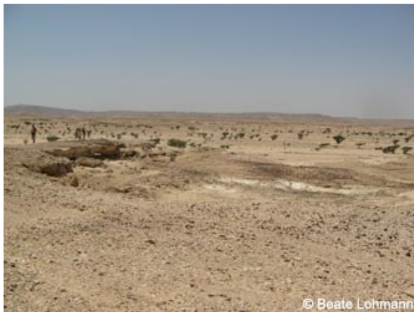
Abb. 5: Landschaft im Oman mit ...

Das Weihrauchgeschenk der Weisen aus dem Morgenland symbolisiert daher indirekt Gottes Vergebung der Sünden, indem er Jesus als seinen Sohn schickt. Katholiken benutzen Weihrauch zum Gebet, da sein Rauch wie ein Gebet zum Himmel aufsteigt (in der Bibel z. B. in Psalm 141, Offenbarung 8,4 und an weiteren Stellen beschrieben). Ein elementarer Bestandteil der Symbolik des Weihrauchgeschenkens ist die Verehrung von Jesus göttlicher Herkunft.