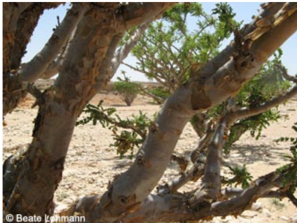
Abb. 7: Stämme des Somalischen Weihrauchs ( Boswellia sacra ) im Oman

Bei Boswellia sacra handelt es sich um kleine gedrungene, obstbaumähnliche Bäume mit unpaarig gefiederten Blättern. Die weiblichen Blüten mit orange-rötlichen Staubbeuteln sind 5-zählig und zu einem Blütenstand zusammengefasst. Zeitpunkt der Blüte ist April, als Frucht wird eine dreikantige, beerenartige Steinfrucht ausgebildet.