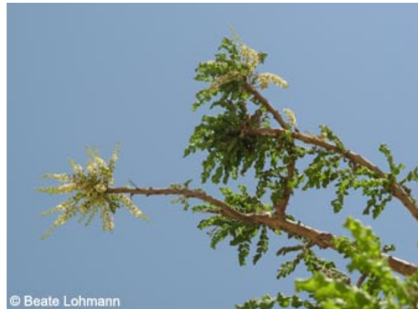
Abb. 8: Blühendes Exemplar