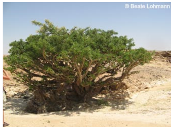
Abb. 6: ... Somalischem Weihrauch ( Boswellia sacra )

Myrrhe wurde in vielen Kulturen Toten bei der Bestattung beigelegt, zudem wurden sie mit Myrrheextrakt einbalsamiert. Dieses Geschenk kündigt bereits bei seiner Geburt Jesus Tod an. Daher kann man das Myrrhegeschenk als Betonung Jesus menschlicher (sterblicher) Seite deuten.