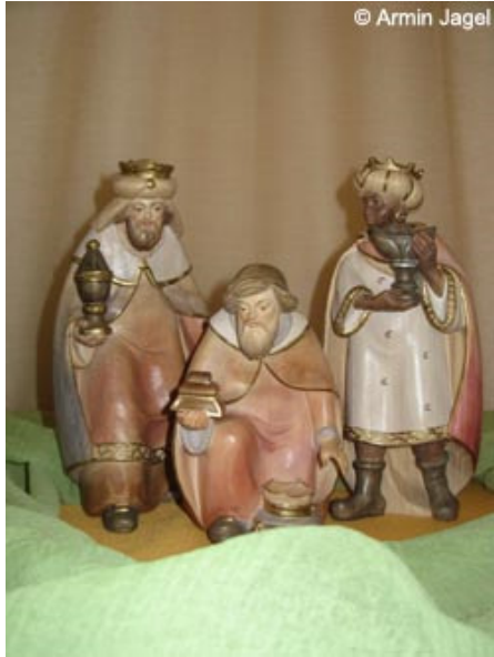
Abb. 2: Die drei heiligen Könige mit Weihrauch, Gold und Myrrhe.

So wurde zum Beispiel von den drei Gaben Gold, Weihrauch und Myrrhe auf die Anzahl der Männer geschlossen - im Matthäusevangelium ist nur von Weisen die Rede, nicht von drei. Als Herkunft der Weisen wird das Morgenland genannt, also ein Land östlich (Himmelsrichtung des Sonnenaufgangs) von Israel. Man nimmt heute an, dass es sich dabei um Persien handelt und dass die Weisen naturwissenschaftliche Gelehrte, vielleicht Astronomen, mit einem religiösen Hintergrund waren. Die Bezeichnung der Weisen als Könige wurde erst einige Jahrhunderte nach der Niederschrift des Evangeliums verbreitet und weitere Jahrhunderte später erhielten die Könige ihre Namen Casper, Melchior und Balthasar. Die Darstellung Melchiors als Farbigen geht auf noch jüngere Zeit zurück, ebenso zahlreiche weitere Details wie der Ritt auf Kamelen usw.