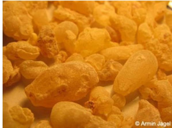
Abb. 11: ... und des Indischen Weihrauchs ( Boswellia serrata = Boswellia glabra )

Weihrauch war bereits 1700 Jahre v. Chr. derart begehrt, dass es ein wichtiges Handelsprodukt wurde und zur Bildung der sog. Weihrauchstraße, einer blühenden Handelsstraße zwischen Arabien und dem Mittelmeer führte. Im Mittelmeer wurde Weihrauch schon von den Ägyptern und Phöniziern bei rituellen Handlungen verwendet und auch schon sehr früh medizinisch angewendet, indem die positive Wirkung bei Wundheilung oder Atemwegserkrankungen genutzt wurde und man deswegen die außerordentlich hohen Produktkosten in Kauf nahm. Auch bis heute bekannte Heilkundige wie Hippokrates und Hildegard von Bingen empfahlen Weihrauch für verschiedenste Leiden.